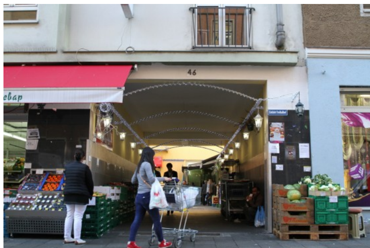
Schmelztiegel der Stadt: In der Landwehrstraße gibt es türkische und arabische Lebensmittelgeschäfte, viele Friseurläden und Shisha-Lokale.

Das Leben spielt sich vor allem auf der Straße ab. Drei junge Männer sitzen auf der Stufe vor einem Friseurladen mit Teegläsern in den Händen. Drüben beim Gemüsehändler stehen Frauen mit Kopftüchern vor den überbordenden Gemüseauslagen und prüfen streng die Qualität der Ware. Es duftet nach frischen Feigen und Orangen, drinnen im Süpermarket stapeln sich türkische Lebensmittel aller Art in den Regalen. Es gibt Baklava im Sonderangebot, auch arabisches Brot ist gerade besonders günstig. Das muss sich herumgesprochen haben: Ein paar Frauen in schwarzem Tschador und Niqab-Schleier schieben Einkaufswagen durch die engen Gassen des türkischen Supermarkts. Auch sie sind hier seit einiger Zeit zu Hause, die einst türkischste Straße der Stadt wird zunehmend arabisch.