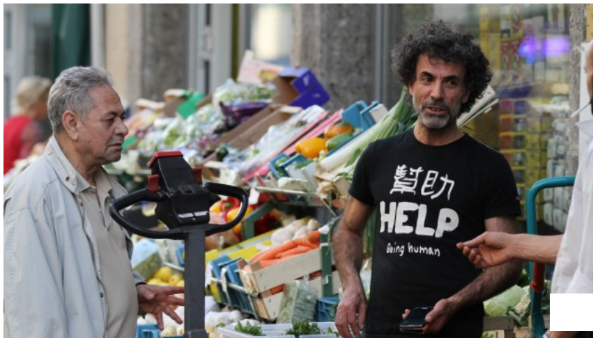
Die Landwehrstraße schläft nie, viele Geschäftsbesitzer kennen sich untereinander.

Das Tor zum Orient: Die einst türkischste Ecke Münchens wird immer arabischer. Die Landwehrstraße schläft nie - hat aber mit einem Problem zu kämpfen.